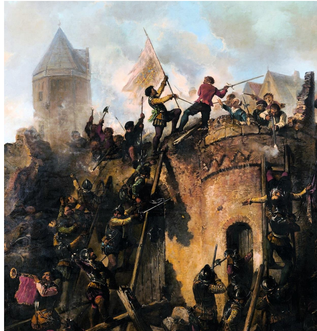
Herman F.C. ten Kate, bestorming van Alkmaar op 18 sept. 1573