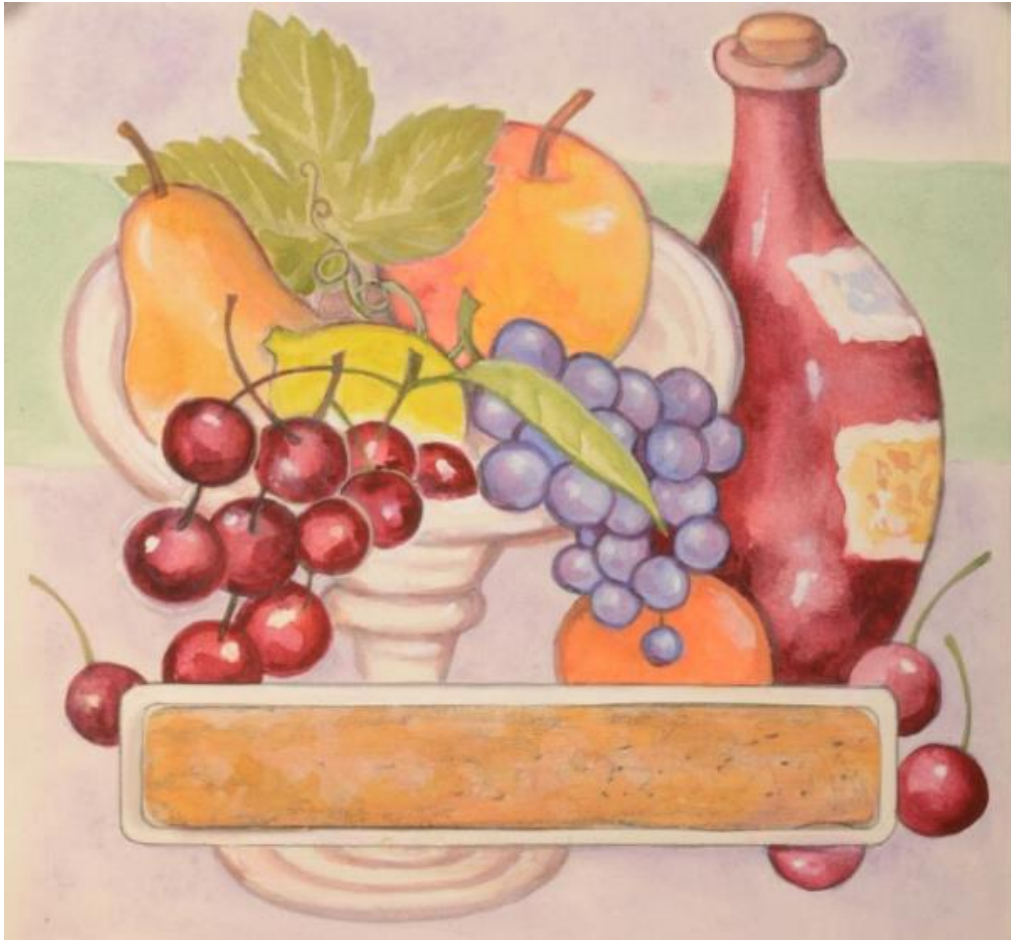
Titel: Aquarel van fruit en een bolle fles Maker: Rie Kooyman Jaar: onbekend Materiaal: waterverf, grafiet en papier